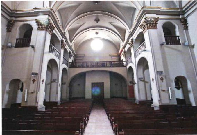
L'església just abans de ser pintada, 2011

per part dels fidels per poder acabar de cobrir el conjunt de despeses ocasionades per les obres.